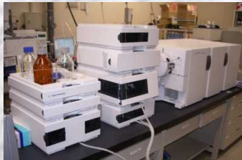
LC / MS / MS測定