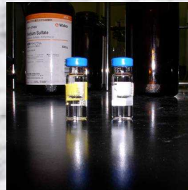
濃縮・バイアル詰め