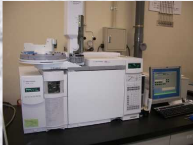
GC / MS測定