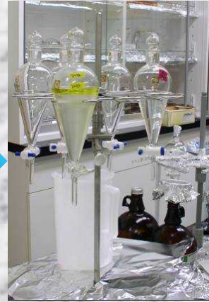
液 - 液抽出工程