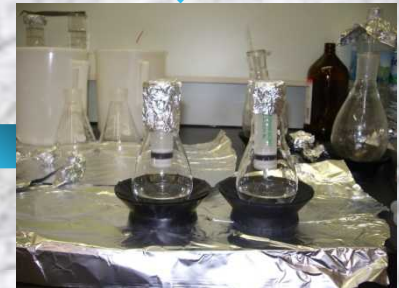
ミニ固相カラム精製