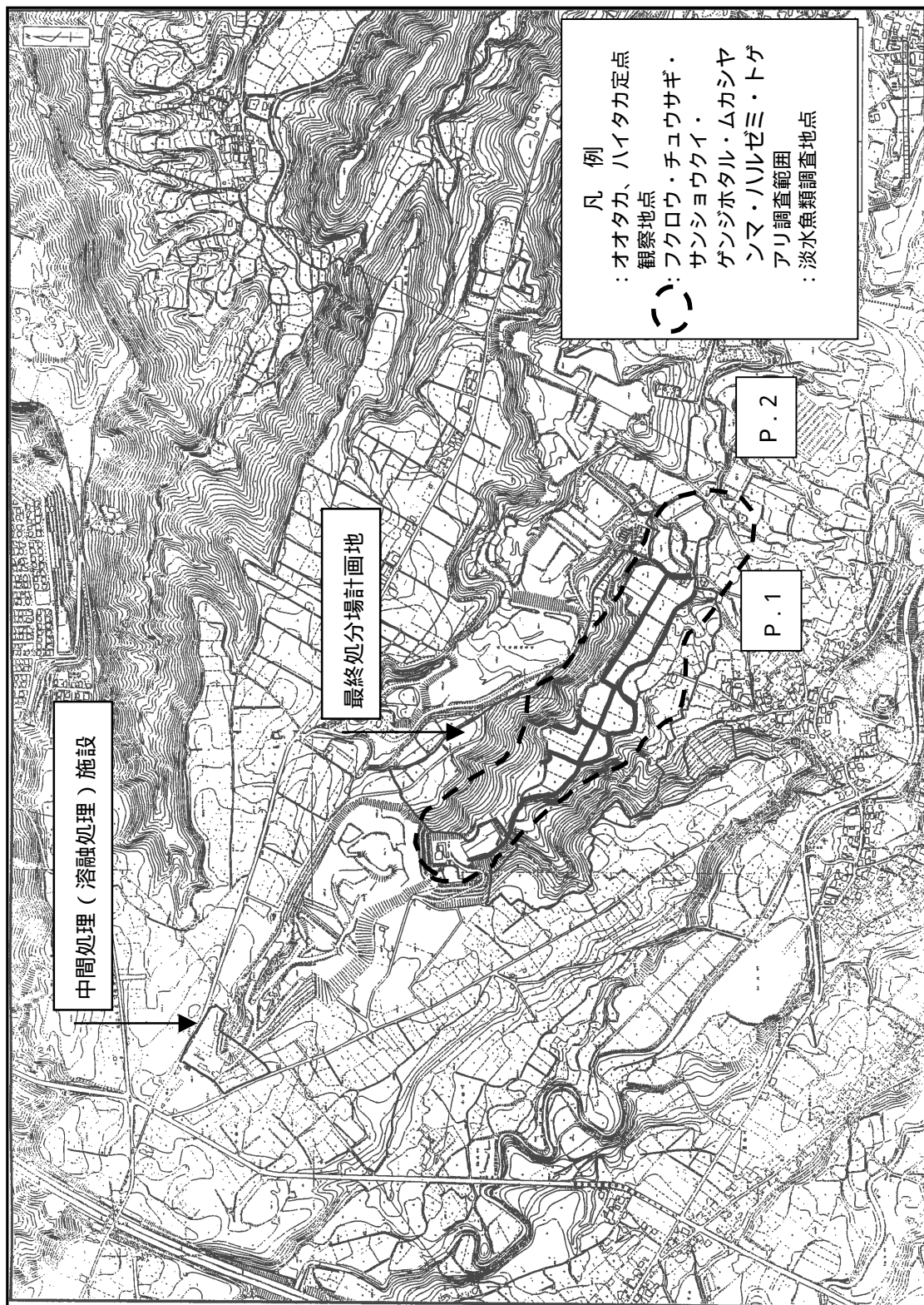
図 - 7 特筆すべき動物・淡水魚類調査地点