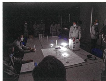
停電を想定した災害対策本部の設置

お問い合わせ先 廃棄物管理部 管理課 tel 059-328-2567 fax 059-328-2967