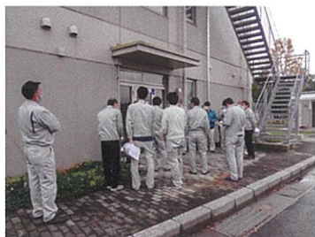
停電時の入室方法を確認する職員

これからも訓練を継続し、防災意識の向上、防災資器材の使用方法的再確認及び、より有効なBCPの確立を目指します。