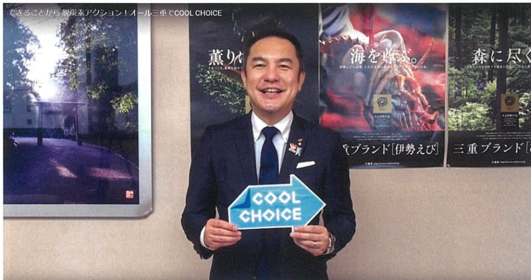
撮影時風景（鈴木英敬 三重県知事）

日頃の小さな選択が未来を大きく変えていきます。この機会にライフスタイルを見直し、私たちの挑戦で未来を変えましょう。