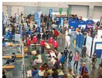
みえ環境フェア2022の様子

2023年度は、「みえ環境フェア2023」として、12月10日開催予定です。多くの皆様の来場をお待ちしています。