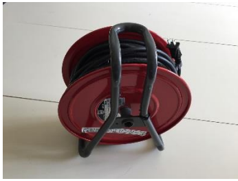
⑥-1 ドラム式延長コード