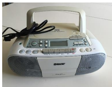
⑨-2 ラジカセ (CD・カセット)