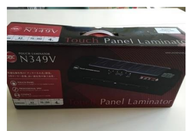
⑦-1 ラミネーター(A3 版)