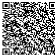
各様式ダウンロード