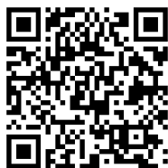
行政担当窓口一覧