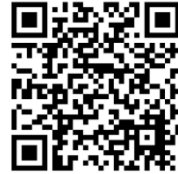
様式ダウンロード